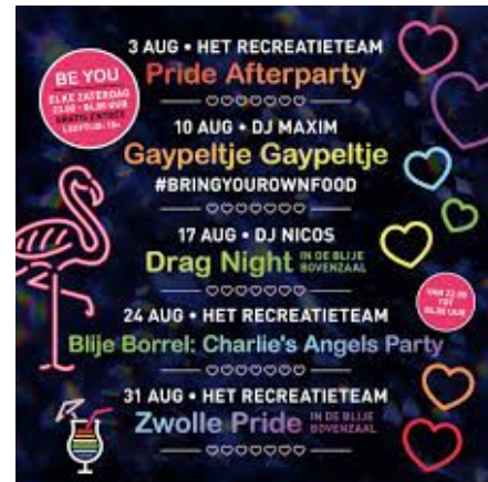
Voorbeeld maandelijks overzicht Be You in de Danskamer