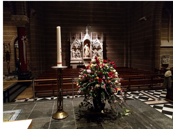
Boeket gemaakt van een ieder die een bloem meebracht naar de Viering van Liefde

Ook werd in die week de manifestatie 'Viering van de Liefde' gehouden bij het Homomonument in Amsterdam. Met deze manifestatie werd de kracht van liefde tegenover de afwijzing en uitsluiting van de orthodox-protestantse Nashville verklaring gesteld.