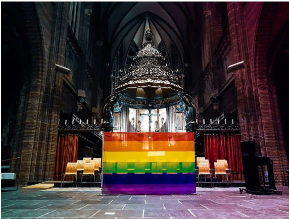
Kort voor de opening van de deuren van de Dominicanenkerk

Op initiatief van COC Zwolle, Stichting Zwolle Pride, Dominicanenklooster Zwolle, Academiehuis de Grote Kerk Zwolle, de lhbt-gemeenschap en diverse kerkgenootschappen hebben we in Zwolle, in samenwerking met de gemeente Zwolle, de 'Viering van Liefde' georganiseerd en gehouden op zondag 13 januari. Ruim 500 bezoekers kwamen samen in de Dominicanenkerk om gezamenlijk uit te dragen dat de liefde er is om gevierd te worden en dat ieder mens het verdient om zich in de kerk en daarbuiten geliefd en welkom te voelen, ongeacht seksuele oriëntatie, genderidentiteit of geslachtskenmerken. Deze viering van liefde heeft een verbondenheid en kracht gegeven die nog lang voelbaar zal zijn.